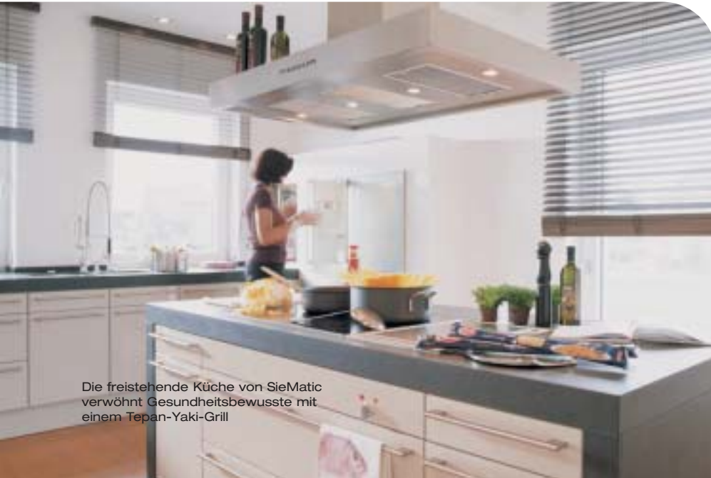
Die freistehende Küche von SieMatic verwöhnt Gesundheitsbewusste mit einem Tepan-Yaki-Grill