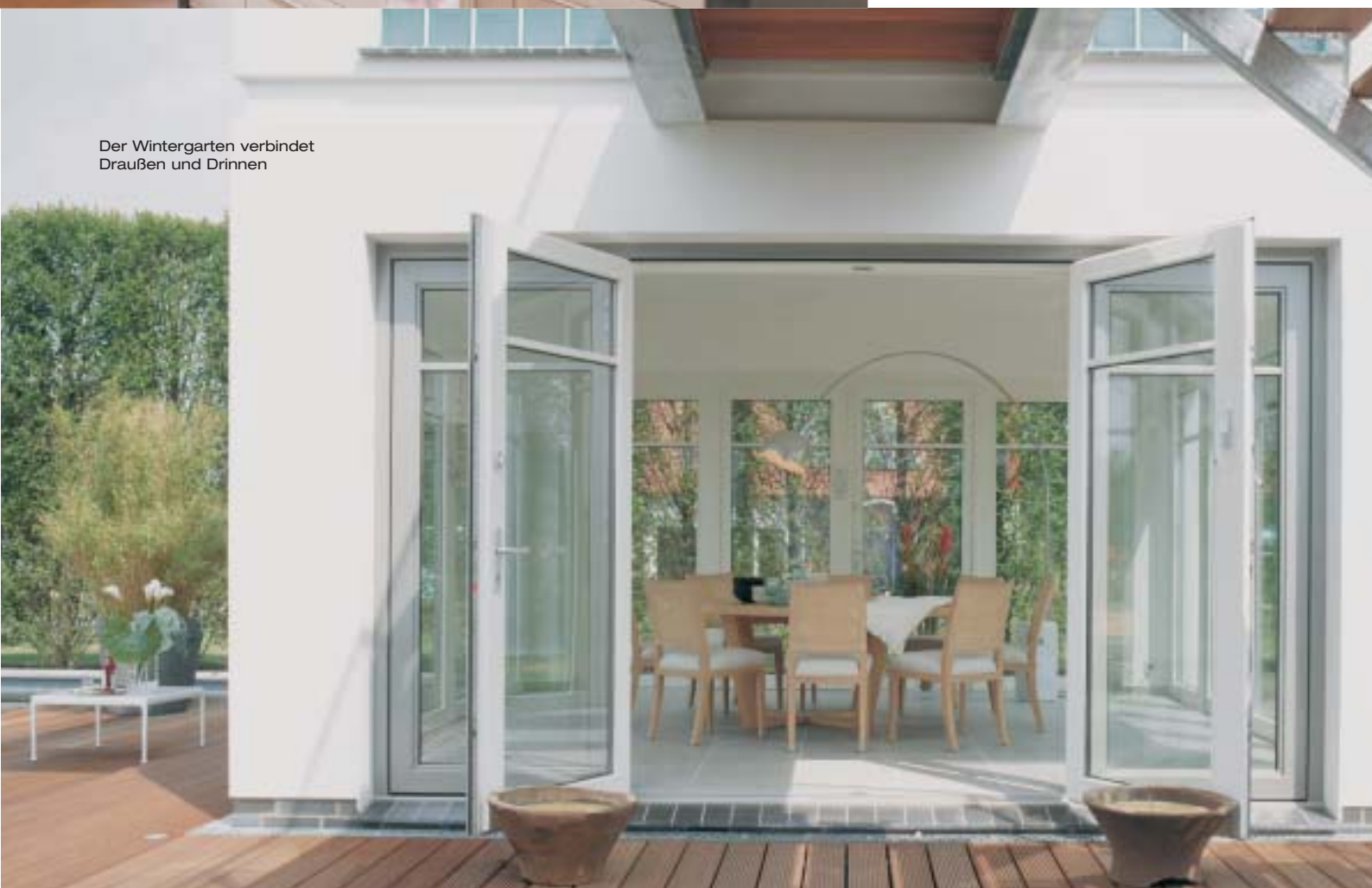
Der Wintergarten verbindet Draußen und Drinnen

Die renommierten Hausbauer haben sich prominente Unterstützung in Sachen Stil gesichert, Jette Joop durfte nämlich bei diesem Haus mit Rat und Tat zur Seite stehen, hinsichtlich des Stylings und auch der Details. Vom Grundriss über die Eingangstür bis hin zu den Badarmaturen gestaltete die Designerin das Haus en gros und en detail. ▶