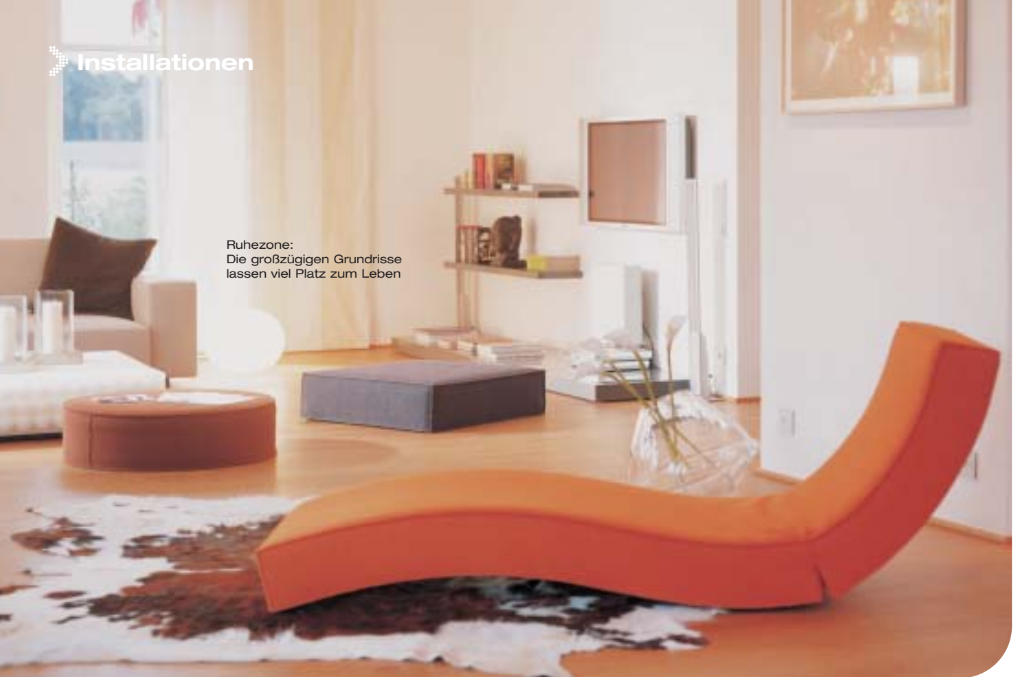
Ruhezone: Die großzügigen Grundrisse lassen viel Platz zum Leben