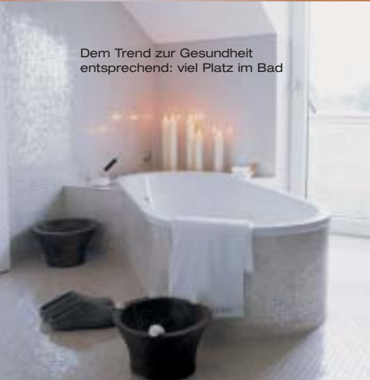
Dem Trend zur Gesundheit entsprechend: viel Platz im Bad

► Im Leben wie im Design sind die einfachsten Dinge meist die schönsten, lautet das Credo der Designerin, deshalb bestimmt das Quadrat viele ihrer Entwürfe, auch den für Viebrockhaus. Die markante Lichtkuppel ist symbolisch für den Charakter des Hauses, viel Licht und offene Räume prägen dort das Leben.