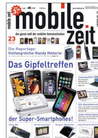
Mobile Zeit Ausgabe 5.2009

Kompetente Hardwaretests decken Stärken und Schwächen auf, eine frische Schreibe und ein übersichtliches Layout sorgen dafür, dass die Informationen den Leser auch erreichen. Der Themenschwerpunkt: Mobiltelefone, Smartphones und Notebooks – all das, was uns auch fernab von zu Hause miteinander verbindet. Keine Hardware ohne die zugehörige Infrastruktur: Ob Bluetooth oder Wireless LAN, ob GSM oder UMTS, die aktuellen und zukünftigen Standards und Netze sind für Mobile Zeit ebenso ein Thema wie die immer wichtiger werdenden Inhalte. Die Zielgruppe: Mobile Menschen von 14 bis 49. Ob Erstkäufer eines Handys oder versierte, digitale Nomaden, Mobile Zeit bietet der gesamten Bandbreite von Nutzern fundierte Informationen beim Kauf von Handys, Smartphones und Notebooks und darüber hinaus. ■